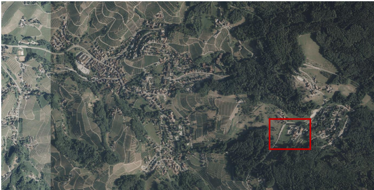
Luftbild (ohne Maßstab)